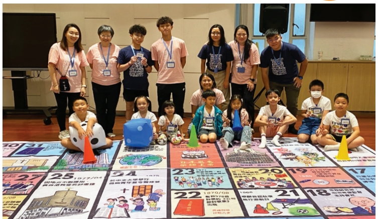
以棋盤遊戲的方式，讓小朋友更有趣味地學習教會歷史 | 47