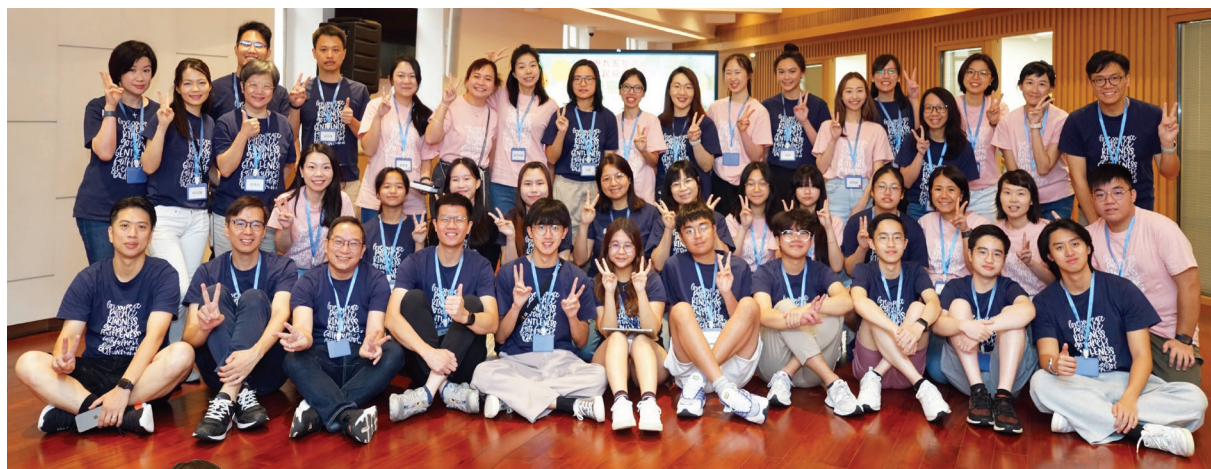
兒童夏令營主內同工