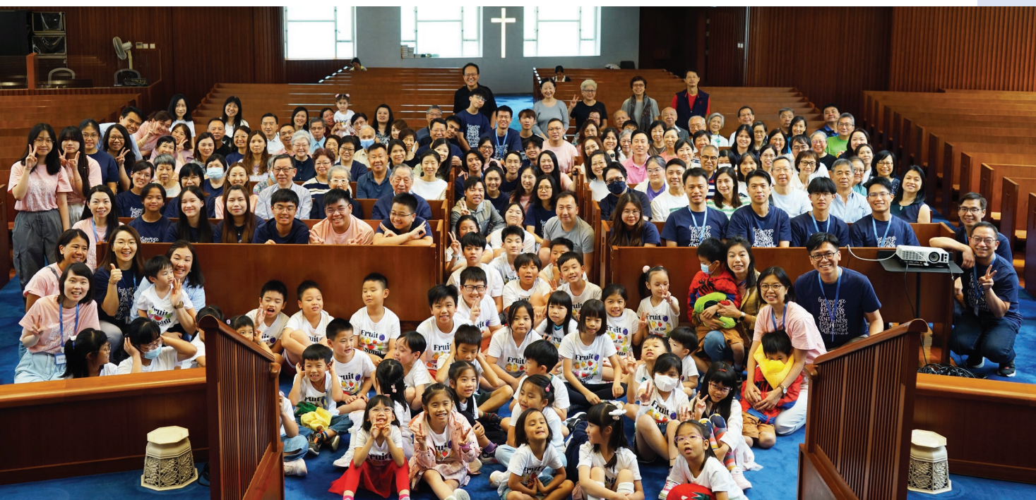
兒童夏令營感恩分享會

「聖靈所結的果子，就是仁愛、喜樂、和平、忍耐、恩慈、良善、信實、溫柔、節制。這樣的事沒有律法禁止。」（加拉太書5章22至23節）