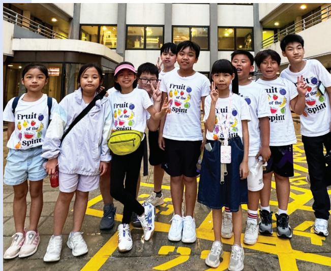
高小組學生於美荷樓宿營