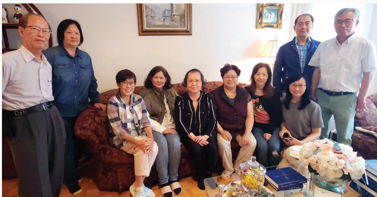
2024年6月開始增添研經環節

我們仍在探索多倫多團契之願景，懇請各位為多倫多團契代禱，企盼此奮興能持續下去，讓團契成為一個成就主旨意、合乎主使用的器皿，預備行各樣的善事。我們暫定維持每季聚會一次，2024年度第三季聚會於9月8日舉行，研讀經文為啟示錄19章6至9節，主題是「我活在世上為了什麼？」