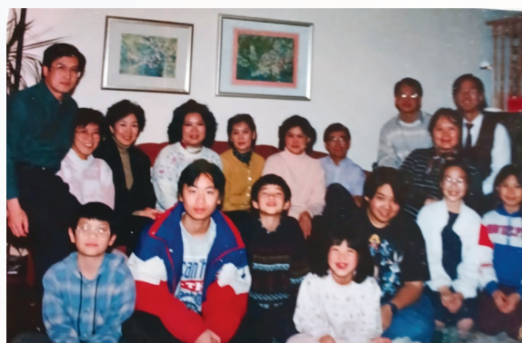
下一代參與家庭團契聚會