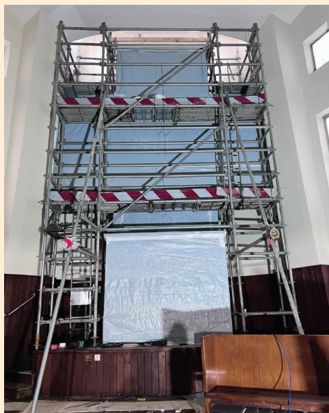
2026年5月工程進度 (附註：九龍副堂張貼了建築師的設計圖供教友參閱)